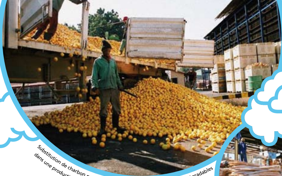
Substitution de charbon par la biomasse (dans ce cas des déchets biodégradables dans une production de jus d'orange en Afrique du Sud)